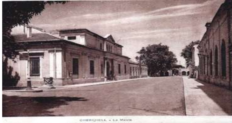
Mairie de Cherchell.

-OUED FEDJANA : Le centre de population d'EL-FEDJANA est créé à 12 kilomètres de MARENGO vers CHERCHELL (vers ZURICH) par arrêté du 3 mai 1872. Le territoire est loti en fermes et prend le nom de FEDJANA. Les concessions sont surtout attribuées dans les années 1880-1883.