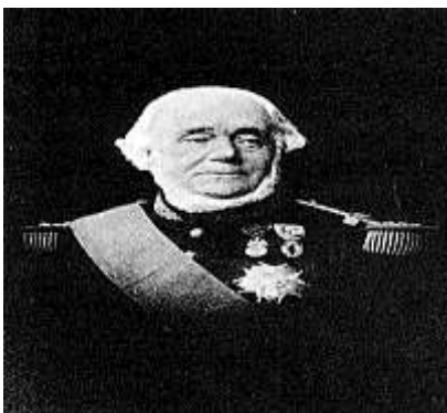
Amiral Louis GUEYDON (1809/1886)

Plus de 250 tribus se soulevèrent en 1871, soit un tiers de la population de l'Algérie. Dans notre région les chefs étaient encore des BERKANIS : SI MALEK tué dans une escarmouche et l'ancien agha KADDOUR.