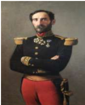
Eugène CAVAIGNAC (1802/1857)

Le commandant CAVAIGNAC, du bataillon d'Afrique, fut nommé commandant supérieur de la ville de CHERCHELL et toutes les tribus des zones montagneuses comme CHENOUA, MENASSEUR, SIDI-SEMIANE, TAOURIRA et GOURAYA furent placées en territoire militaire. Ces tribus étaient morcelées de la sorte en grandes fractions, devenues à la longue indépendantes l'une à l'autre.