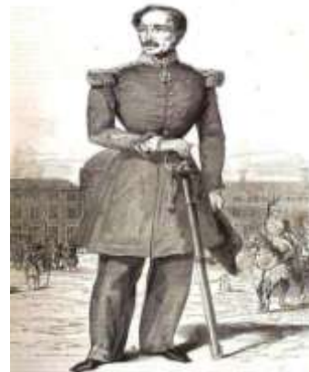
Nicolas CHANGARNIER (1893/1877)