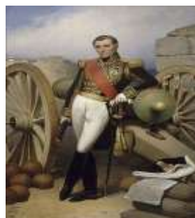
Sylvain VALEE (1773/1846)