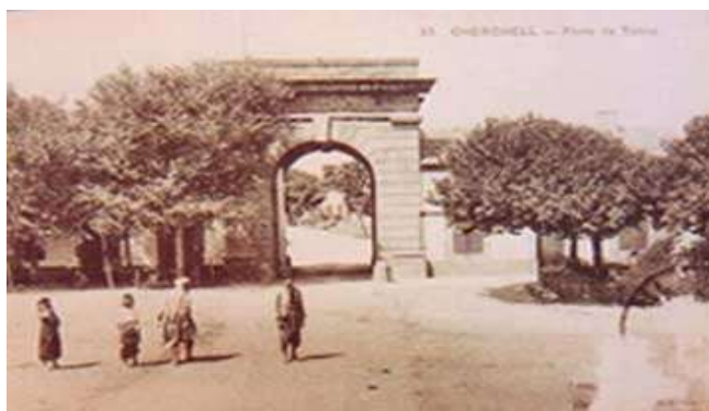
Porte d'accès à CHERCHELL

L'occupation de CHERCHELL devait donc être et fut en réalité le premier acte de la campagne de 1840. Le corps expéditionnaire, fort d'environ 12 000 hommes, parti en trois colonnes de BLIDA et de KOLEA, le 12 mars, s'est réuni, le 15 dans un Bordj, et a continué sa marche, en une seule colonne, sur CHERCHELL. Le 15, à dix heures du matin, il arriva devant la ville, qu'à son approche les habitants avaient évacuée. Les Kabyles en avaient fermé les portes ; elles furent abattues par deux coups de canon. Le 17 e Léger entra dans la place, sur laquelle le pavillon tricolore fut immédiatement élevé. Aucun militaire de l'expédition ne fut tué sur le terrain ; 70 militaires furent plus ou moins grièvement blessés ; un seul succomba par suite de ses blessures.