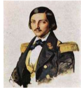
Le prince de Joinville

Le port, l'îlot Joinville et le phare Joinville, du nom de François-Ferdinand d'Orléans, prince de Joinville troisième fils de Louis-Philippe et frère du Duc d'Aumale. Vice-amiral il participa en 1840 au transfert des cendres de NAPOLEON1 er . (Un habitat ancien, datable au moins du V ème siècle avant J.C., a été reconnu au cours des fouilles de l'îlot par les Français dans les années 1860 qui avaient fourni de précieuses informations sur LOL par la mise de vestiges, ainsi que d'une nécropole néo-punique datant du 1 er siècle après J.C. au Cap TIZIRINE. Le mot berbère Tizirine signifie bien : "Les îlots").