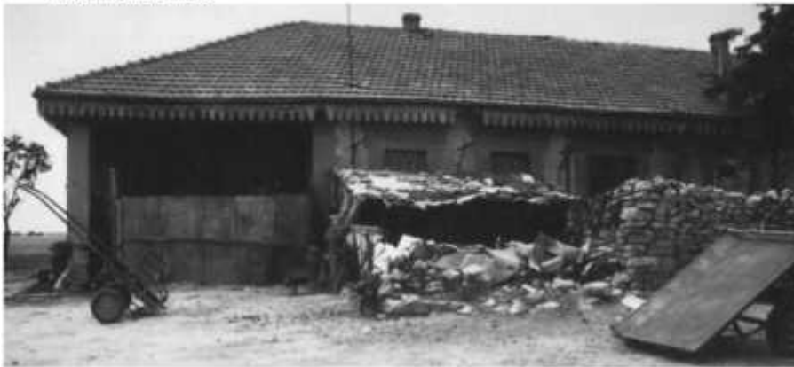
La ferme CARRAZ en 1981

Centre en création nommé BURDEAU par décision du 3 septembre 1904, érigé en Commune de Plein Exercice par décret du 9 août 1924.