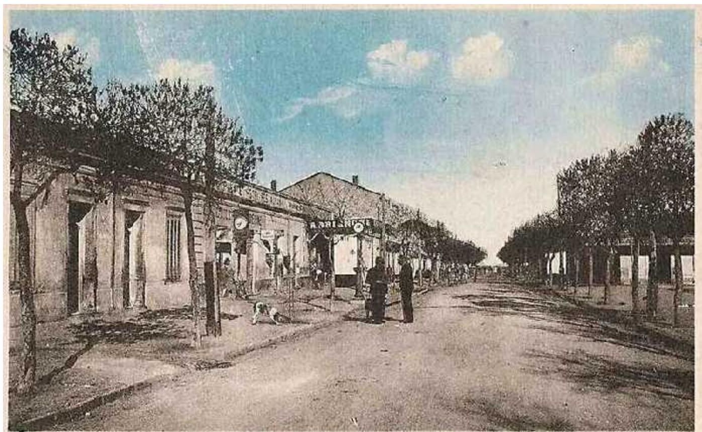
10. BURDEAU — Rue Principale