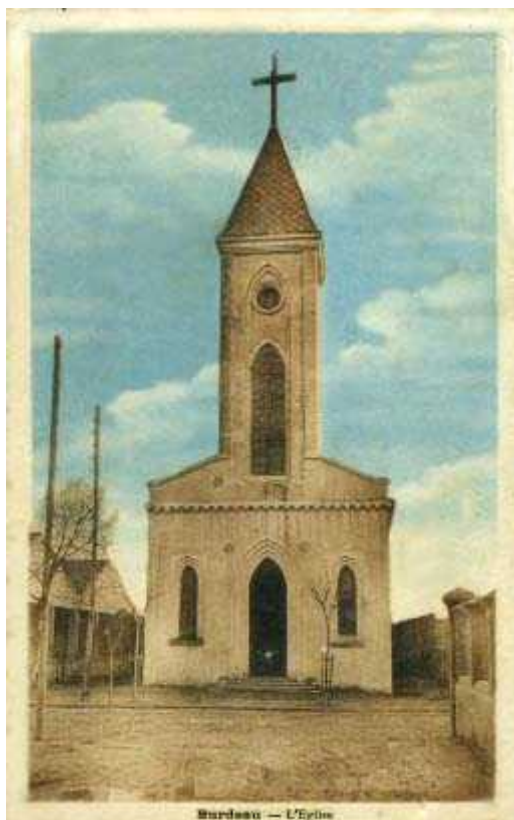
L'abbé PAYNO a été un des curés de BURDEAU avant la guerre.

Cette dernière nuit les préparait aux commodités qui les attendaient au terme du voyage. Il restait 25 km à parcourir, toujours sur la piste à peine tracée au travers de la plaine, et au soir de cette dernière journée les élus parvenaient à la « Terre promise » !