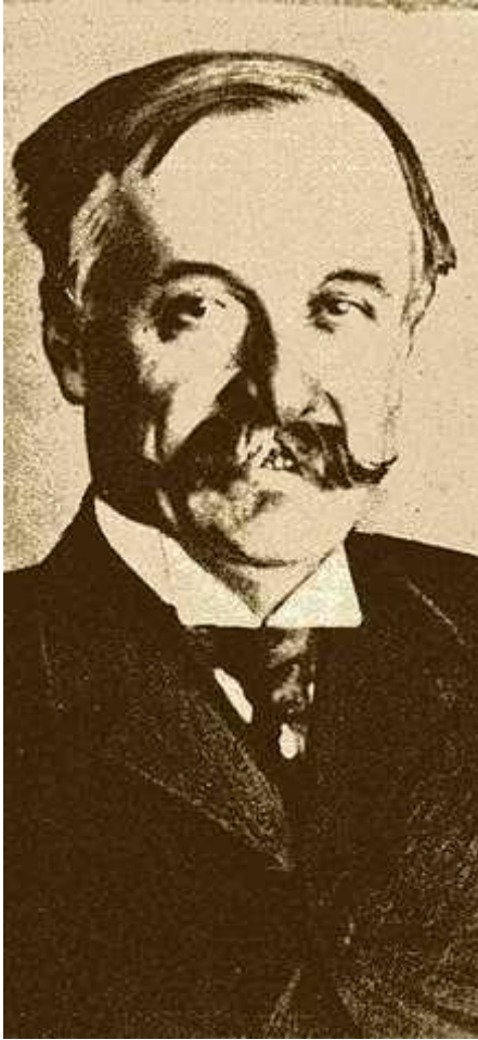
Paul REVOIL (1856/1914)

http://fr.wikipedia.org/wiki/Paul_Revoil