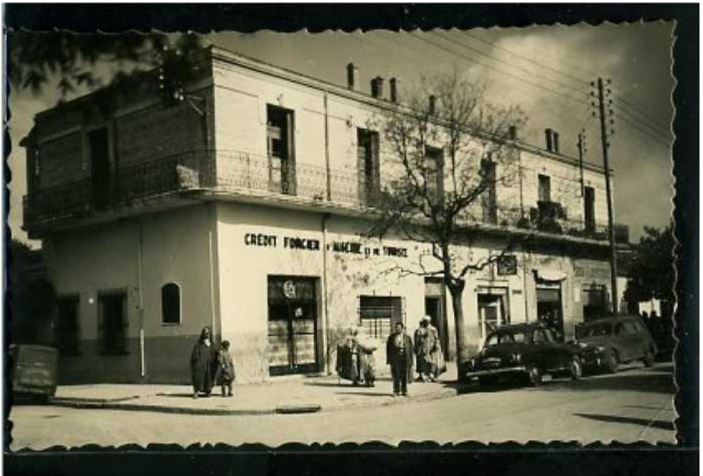
BURDEAU : L'immeuble du Crédit Foncier

Les premiers candidats agréés arrivent à la fin de l'été 1905, à la fin de l'année vingt familles étaient installées et en 1907 la totalité des concessions était occupée.