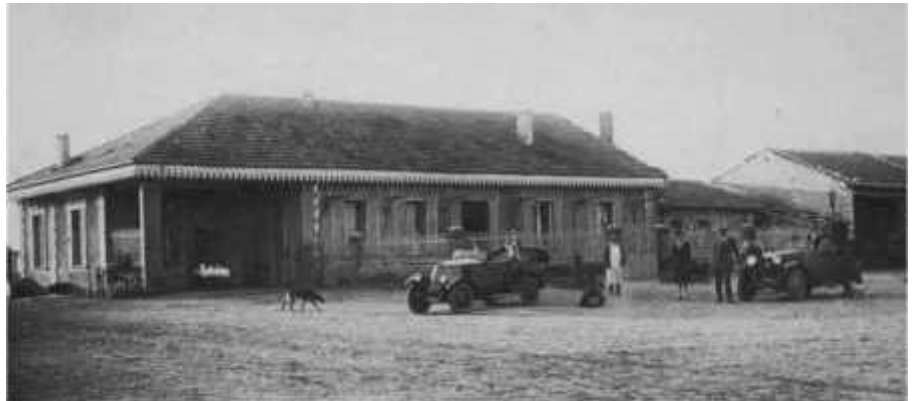
▲ La ferme Carraz en 1927

où plusieurs colons ont pu s'installer avec leurs familles et mettre en œuvre un acharnement à réussir.